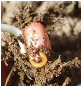
Larve de taupin