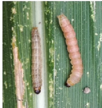
Insectes foreurs : larves de pyrale et sésamies