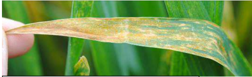
Rouille jaune sur blé et triticale

Focus sur une alternative Retarder la date de semis pour éviter les pucerons à l'automne et diminuer la pression de certaines maladies au printemps