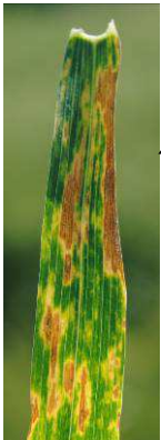
Septoriose sur blé et triticale