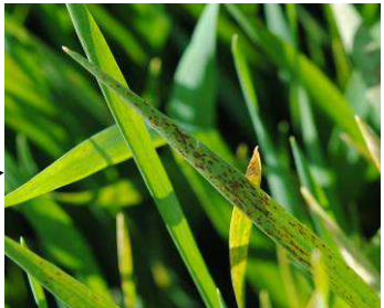
Helminthosporiose sur orge