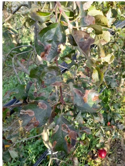
Dégâts sur feuillage en parcelle bio – automne 2023

Les mines sont généralement peu pénalisantes pour l'arbre mais la mineuse cerclée est réglementée pour l'exportation vers les Etats-Unis où son introduction n'est pas autorisée.