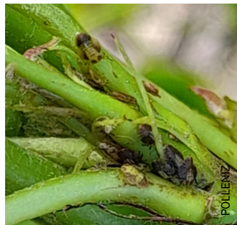
Larves de psylles et miellat