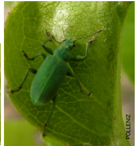
Pécitèle gris et Polydrusus impressifrons